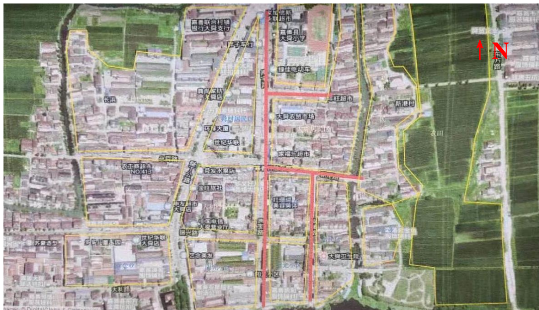
附图 2. 建设项目线路走向图 (西塘镇大舜声宝路、启航路、新港路、舜镇路-西丁路污水管工程项目竣工环境保护验收)