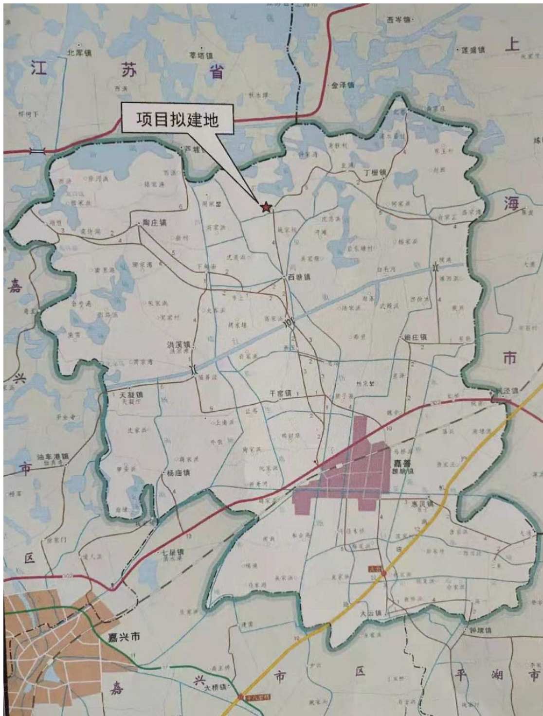
附图 1、建设项目地理位置图 (西塘镇大舜声宝路、启航路、新港路、舜镇路-西丁路污水管工程项目竣工环境保护验收)