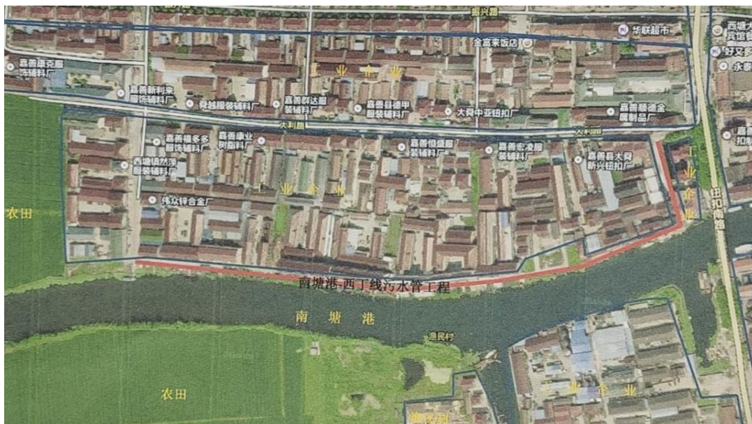
附图 2. 建设项目线路走向图 (西塘镇大舜富舜路、南塘港-西丁线污水管工程项目竣工环境保护验收)