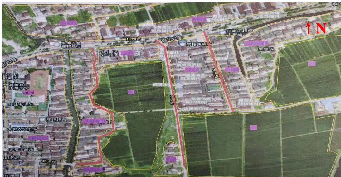
附图 2. 建设项目线路走向图 (西塘镇大舜东方路、诚诚路、新港东侧环村路-西丁线污水管工程项目竣工环境保护验收)